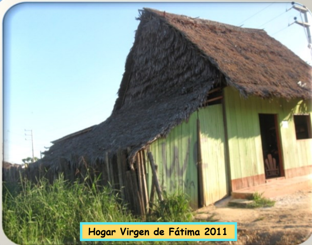
Hogar Virgen de Fátima 2011